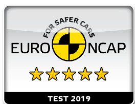
Лого на Euro NCAP с 5 звезди за тестовете 2019

*4: Независима организация за изпитания за сблъсък и оценка на безопасността, подкрепена от седем европейски държави и от автомобилни и потребителски клубове