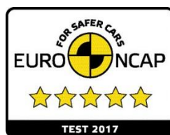
Лого на Euro NCAP с 5 звезди за тестовете 2017