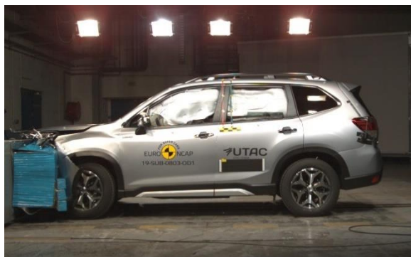
Euro NCAP тест за сблъсък на Subaru Forester e-BOXER (европейски спецификации)