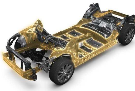
Глобалната Платформа на Subaru