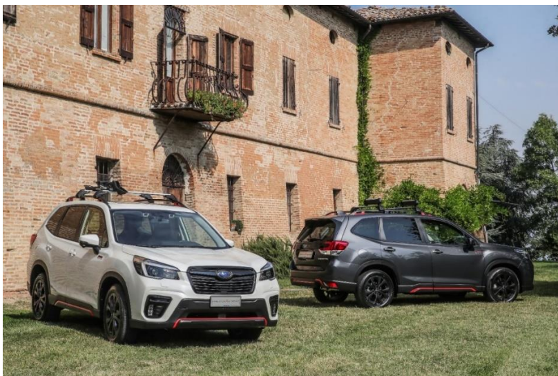
Новият Subaru Forester 4DVENTURE

Новият Forester 4DVENTURE е автомобил с уникални детайли, наистина цялостно оборудване и напълно олицетворява ценностите на Subaru. Автомобилът може да бъде поръчван от представителствата на Subaru в България на ориентируваща цена от 79 990 лв. с ДДС + 990 лв.с ДДС за боя перла/металик.